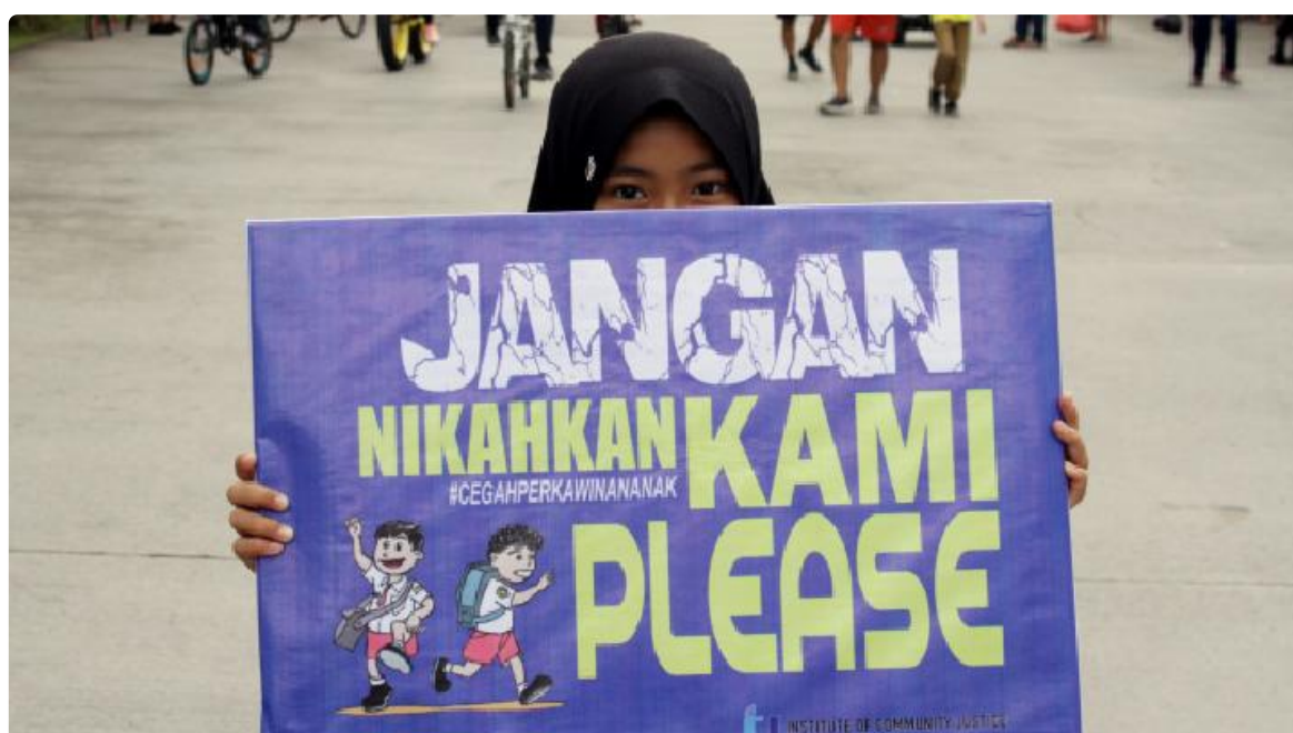
Ilustrasi aksi anti perkawinan anak.

Arri menekankan bahwa perkawinan anak dapat mengakibatkan berbagai macam dampak negatif pada anak perempuan. Misalnya saja dari segi biologis. Ketika perempuan menikah di usia anak, ia akan mendapatkan risiko komplikasi pada kehamilan. Komplikasi ini dapat hadir dalam bentuk persalinan macet hingga konsekuensi kesehatan pada bayi. Sementara itu, aspek psikologis dari anak perempuan ini akan banyak terganggu.